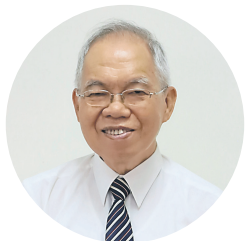
撰文✦陆庭译中医师