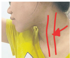
胸锁乳突肌: 眼乾、偏头痛、甲状腺疾病、喉咙紧