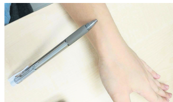
列缺穴: 肩膀手臂痛、喉咙痛

拳击常常需要用手臂出拳, 可以按列缺穴, 帮助肩膀与手臂放松, 帮助出拳更有劲道。